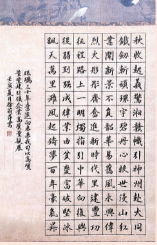
砥砺前行 奋进向未来 (惠多利 徐蔚萍) “精彩兴合”书画大赛三等奖