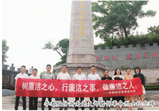
集团各党支部参观清廉文化公园