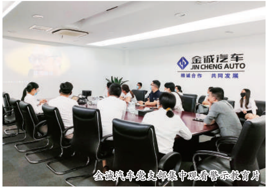
金诚汽车党总支集中观看警示教育片