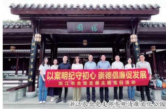
集团各党支部参观清廉文化公园

集团纪委召开(扩大)会议,围绕用好一本案例汇编,集中组织各党组织纪检委员学习《省直单位警示教育案例汇编(第三辑)》。通过对典型案例的学习理解,更好地将案例警示教育作用延伸到各级党组织。集团下属17家党组织召开专题学习会,学习警示教育案例汇编,通过通报汇编中的事件案例和忏悔书,对党员同志开展“沉浸式”党性教育,用身边事教育身边人,促使党员领导干部以案为鉴、反躬自省,警钟长鸣,进一步增强党员干部廉洁自律意识。