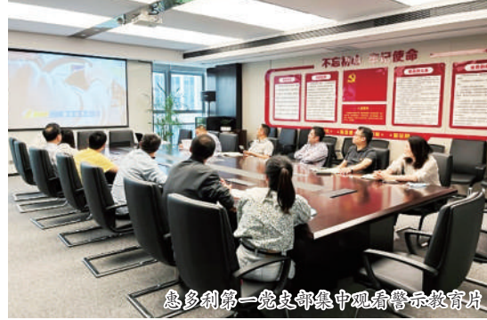
惠多利第一党支部集中观看警示教育片